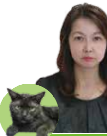
高校生向けアニメ教材の制作やVTuber活動を通じた情報発信の実践