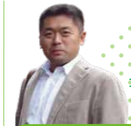
スマホに依存するのではなく、新聞などでニュースにふれましょう。