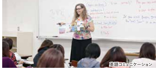
英語コミュニケーション

外国語(英語、フランス語、中国語、韓国語)による実践的コミュニケーション能力を育成します。