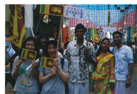
森林セラピー事業 上野の森の会 鶴崎清正公二十三夜祭 木佐上地区活性化プロジェクト AQUAソーシャルフェス2015